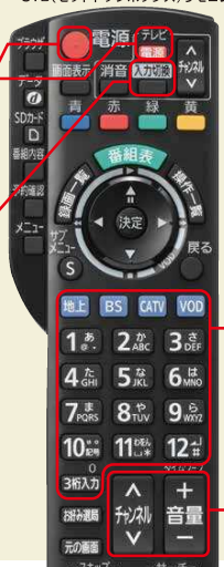
STB(セットトップボックス)リモコン

※STB(セットトップボックス)リモコンで切り換えできない場合は、テレビのリモコンで切り換えてください。