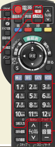
STB(セットトップボックス)リモコン

※STB(セットトップボックス)リモコンで切り換えできない場合は、テレビのリモコンで切り換えてください。