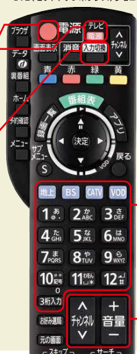
STB(セットトップボックス)リモコン

※STB(セットトップボックス)リモコンで切り換えできない場合は、テレビのリモコンで切り換えてください。