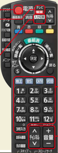
STB(セットトップボックス)リモコン

※STB(セットトップボックス)リモコンで切り換えできない場合は、テレビのリモコンで切り換えてください。