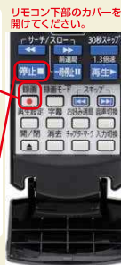
リモコン下部のカバーを開けてください。