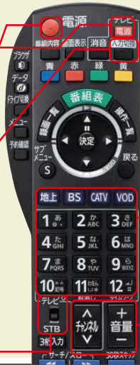
STB(セットトップボックス)リモコン

※STB(セットトップボックス)リモコンで切り換えできない場合は、テレビのリモコンで切り換えてください。