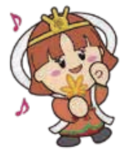
三郷町イメージキャラクター たつたひめ