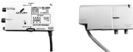
パワーサプライ（電源供給機器）

V-ONUは光信号をテレビ放送波に変換する機器です。同軸ケーブルでパワーサプライと接続して電源を供給しているので、パワーサプライの電源コードが抜けるとテレビの信号が流れなくなってしまったためテレビが映らなくなってしまいます。