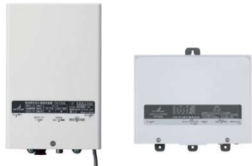
光加入者用テレビ受信機（V-ONU）

「ケーブルテレビが映らなくなった！」 というお問い合わせで、原因として多い のがこのパワーサプライの電源コードの 抜けです。特に掃除や模様替えの後に ケーブルテレビが映らなくなった場合は 電源が抜けていないかを確認してくだ さい。