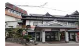
信貴山観光ホテル